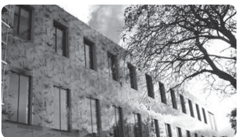
NÝGGJA LØGTINGSHÚSIÐ Landsverk byggir og hevur um hendi viðlíkahald av almennum bygningum. Onnur nýggj dómir: Landsjúkrahúsið og Norðurlandahúsið.