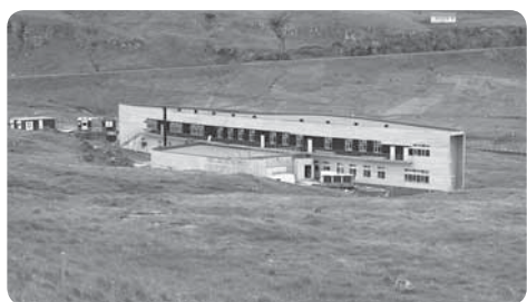
SKÚLADEPILIN Í SUÐUROY Landsverk byggir almennar skúlar. Onnur nýggj dómir: Techniski skúli í Klaksvík og Fiskivinnuskúlan í Vestmanna. Skúladepilin í Marknagili stendur fyri framman.

Umframt tær fimm nevndu deildirnar hevur Landsverk eisini eina fíggardeild og eina starvsfólkadeild.