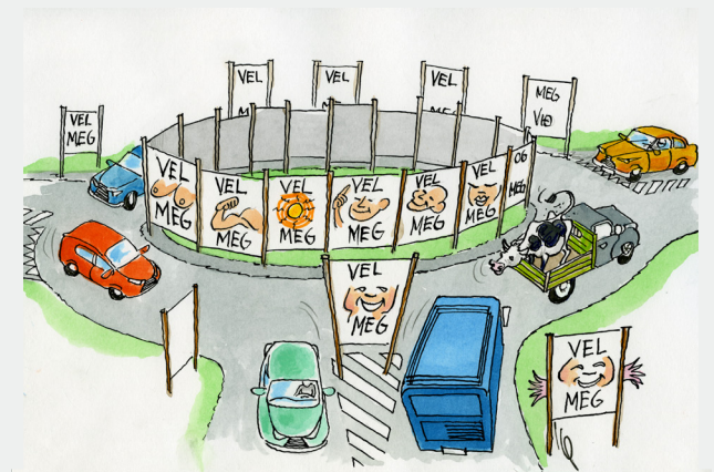
Valplakatir mugu ikki heingjast á rundkoyringum og ferðsluoyggjum